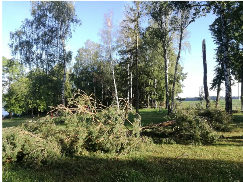
polom na koupališti