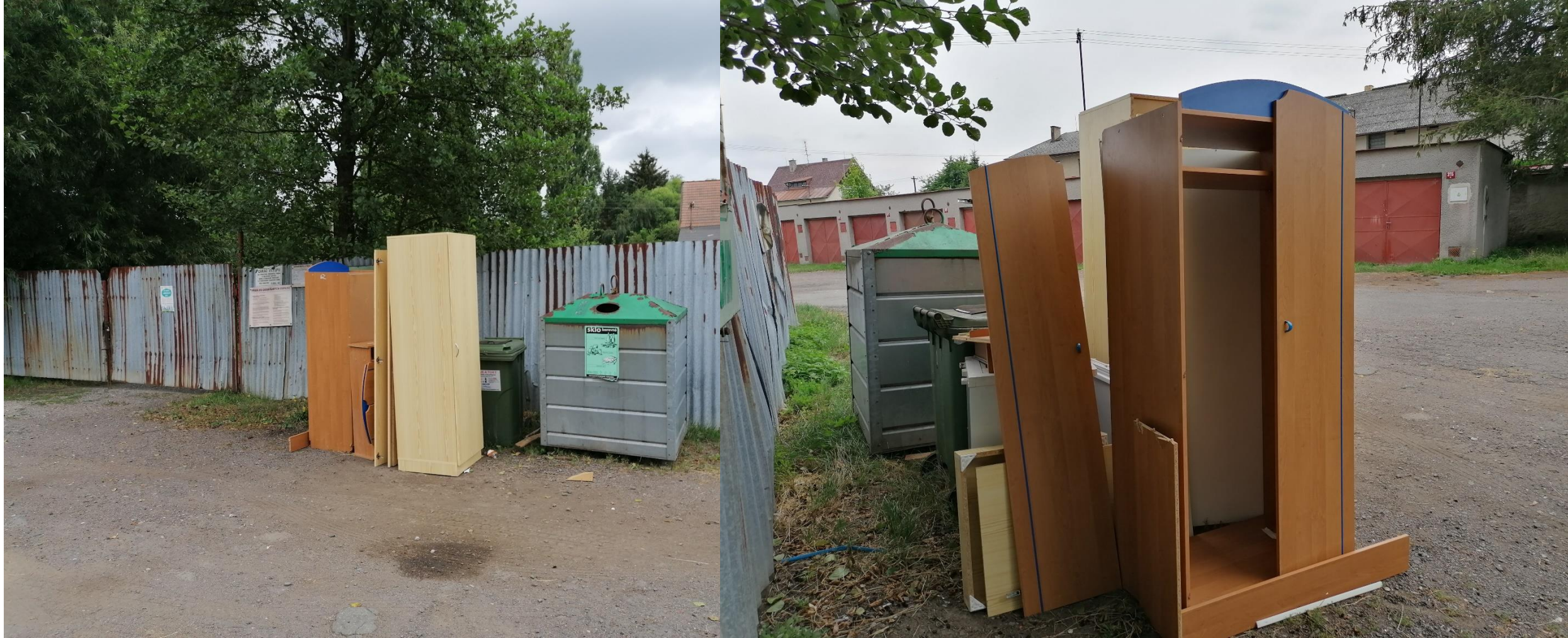
Sběrný dvůr na Polní