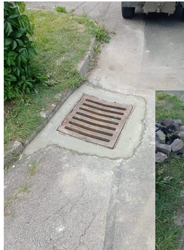
kanál ul.Sázavská dole