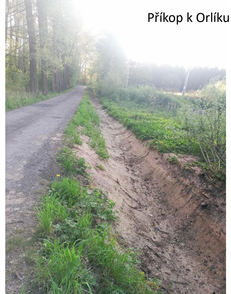
Příkop k Orlíku