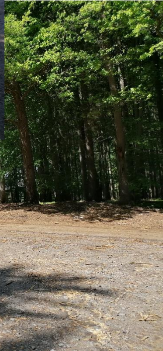
likvidace větví z lesa u Sázavy