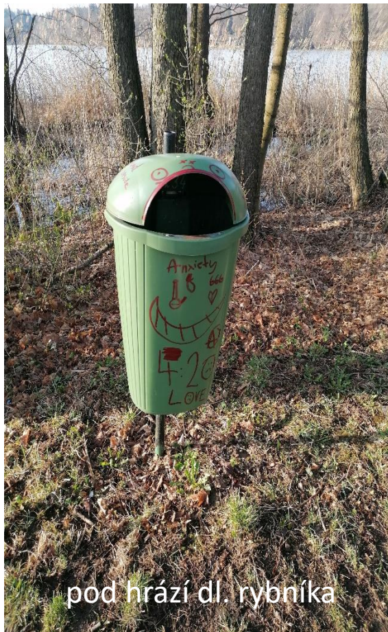
pod hrází dl. rybníka