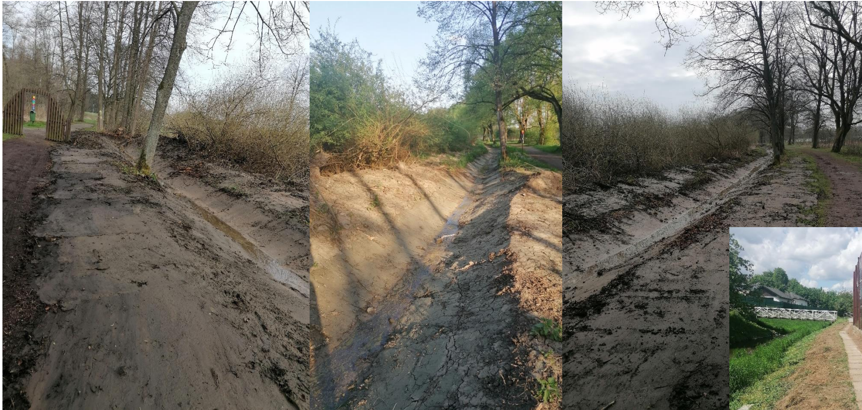
chodníček za PENNY