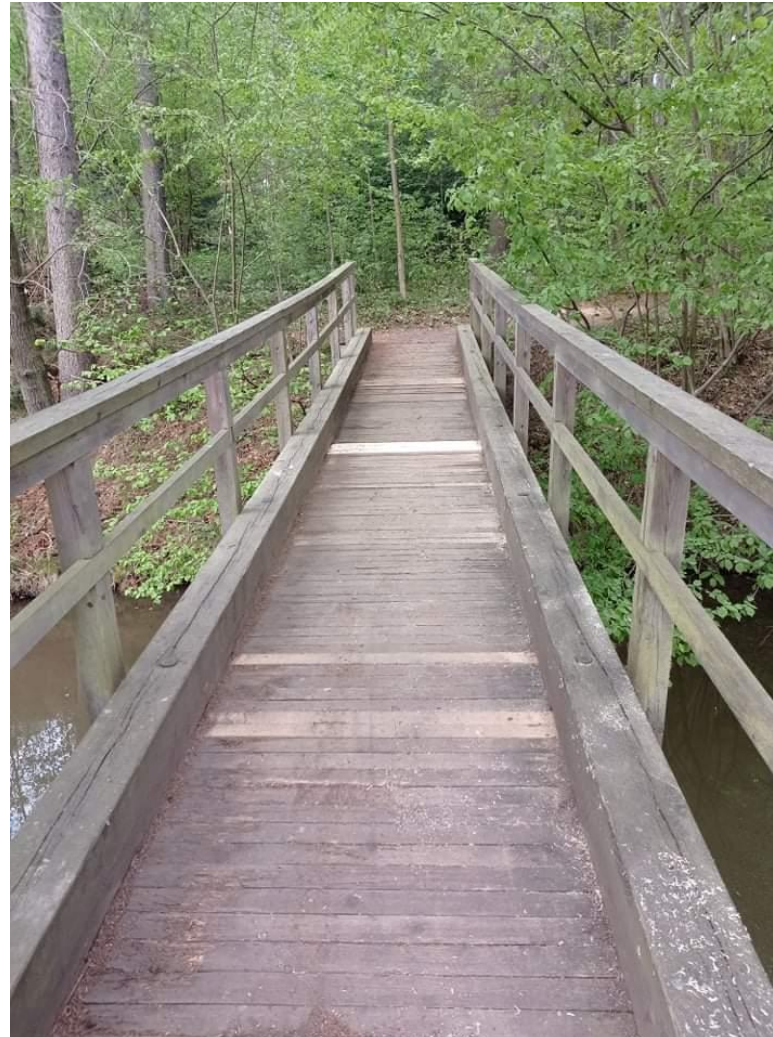
Lávka Slunečný rybník