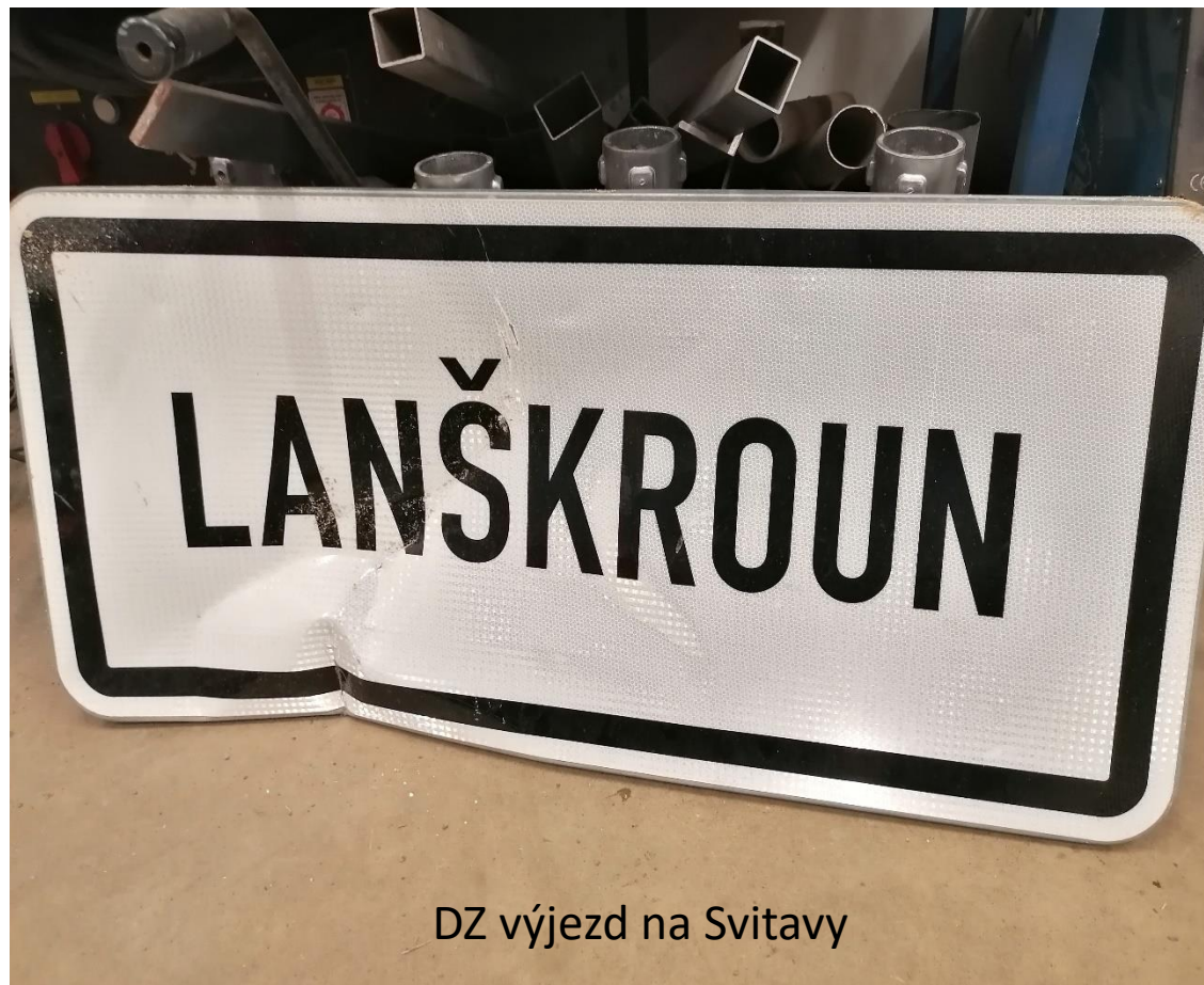
DZ výjezd na Svitavy